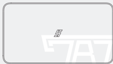
Wielofunkcyjne pudełko do sterylizacji