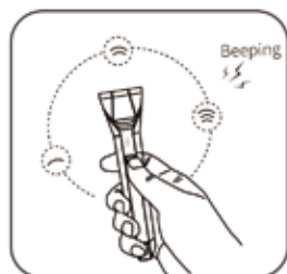
Three level adjustable